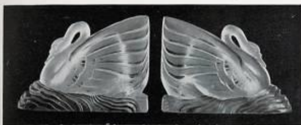
Serre-livres. Les cygnes, par Béal.