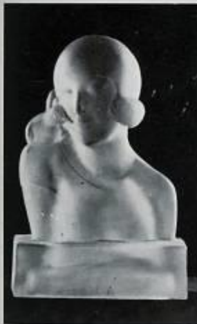
En attendant, par M lle G. Granger.