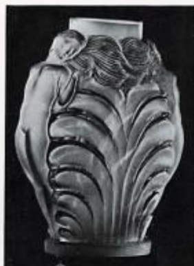
Vase « Femme échevelée », par M me Sevin.