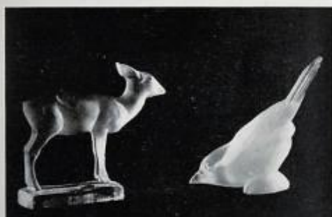
Biche. Rossignol japonais, par Geza Hiecz.