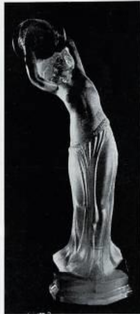
Danseuse aux cymbales, par Delabassé.

matière. Une heureuse sélection de pièces dues à MM. Béal et Delabassé et en particulier à M me Sevin - Delabassé permet de se rendre compte de la diversité des effets obtenus et l'on goûtera l'agrément œuvres décoratives telles que les Parfums d'Orient , ou la Jeune Fille aux Cygnes de M me Sevin, La Danseuse aux cymbales de Delabassé, en qui s'exalte et se résume toute la grâce, toute l'élégance auxquelles permet d'atteindre une technique offrant d'aussi précieuses