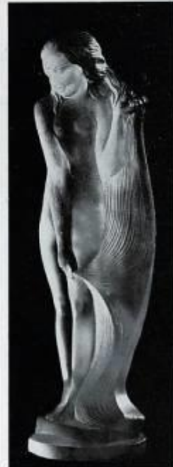
Nu, par Mme Sevin.

la manière, notamment, dont il s'éclaire et s'anime sous l'effet de la lumière.