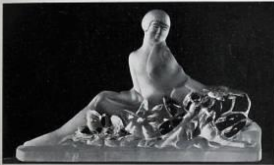
Idylle, par M lle G. Granger.