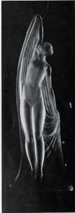
Délassement, par Mme Sevin.

matière. Une heureuse sélection de pièces dues à MM. Béal et Delabassé et en particulier à M me Sevin - Delabassé permet de se rendre compte de la diversité des effets obtenus et l'on goûtera l'agrément œuvres décoratives telles que les Parfums d'Orient , ou la Jeune Fille aux Cygnes de M me Sevin, La Danseuse aux cymbales de Delabassé, en qui s'exalte et se résume toute la grâce, toute l'élégance auxquelles permet d'atteindre une technique offrant d'aussi précieuses