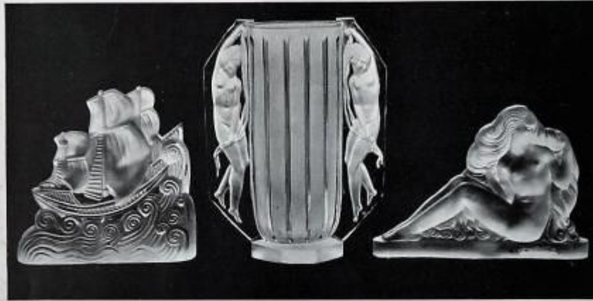
« La Caravelle ».