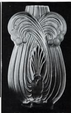
Vase « Oiseaux de Paradis », par M me Sevin.