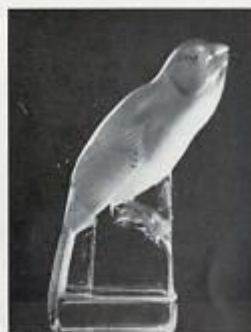
Canari, par Geza Hiecz.