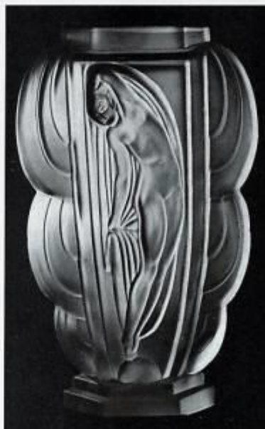
Vase « Danseuse », par M me Sevin.

On n'aimera pas moins, à côté de ces sujets anecdotiques interprétés avec esprit, certaines compositions stylisées, telle cette caravelle de M me Sevin que l'on vit figurer au