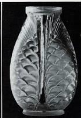
Vase « Pins », par Déal.