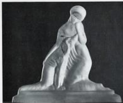
Le Favori, par M lle Sevin.