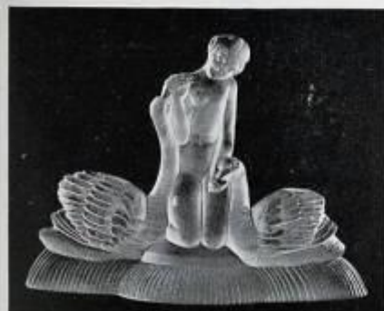
Jeune fille aux cygnes, par M me Sevin.